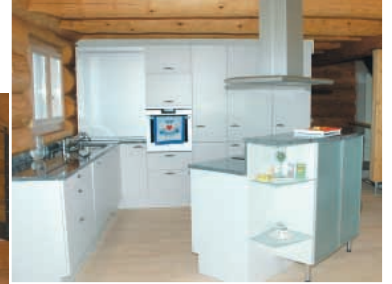
Offene Küche mit freistehendem Herd