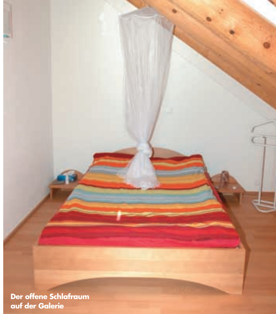
Der offene Schlafraum auf der Galerie

den Sichtsparren und im Schiffsgiebel machen das Hausinnere hell und elegant. Insbesondere die saubere Verarbeitung und Anbindung der Mauerwerkswände tragen zum modernen Ambiente bei. Nachträglich zollen die Bauleute dem Projektleiter dafür höchste Anerkennung.