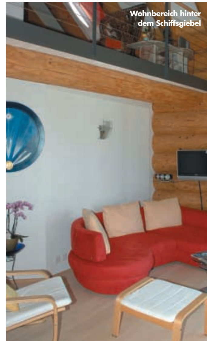
Wohnbereich hinter dem Schiffsgiebel