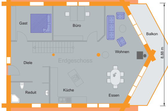
Das Weisstannenhaus bietet auf etwa 14 x 9 Meter runde 160 qm Wohnfläche zzgl. der Kellerräume