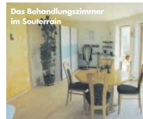
Das Behandlungszimmer im Souterrain