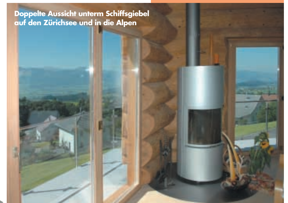
Doppelte Aussicht unterm Schiffsgiebel auf den Zürichsee und in die Alpen

Das Bauherrenpaar hatte sich schnell für einen heimischen Naturstammhaus-