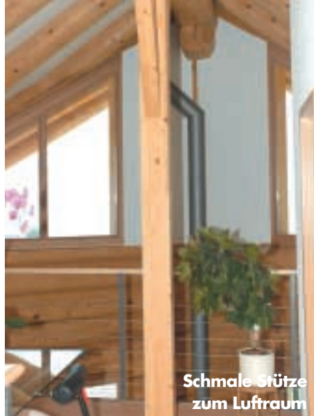
Schmale Stütze zum Luftraum